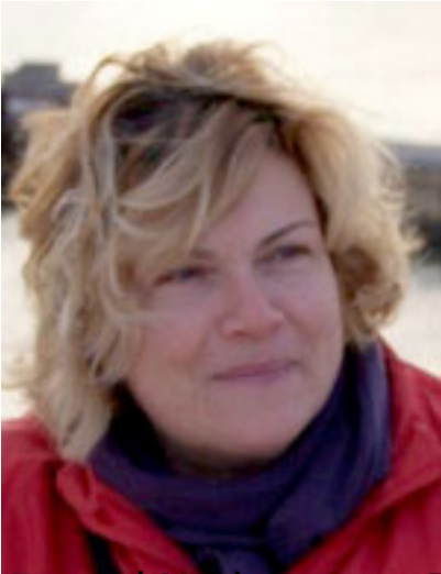
Επίπεδο Χημείας, Φυσικής, Παιδαγωγική Προϊόντα στην Κρήτη Πολιτικός Δορυών Εργων περιβάλλοντος